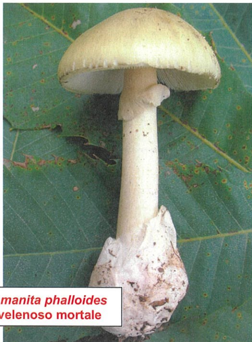
Amanita phalloides velenoso mortale