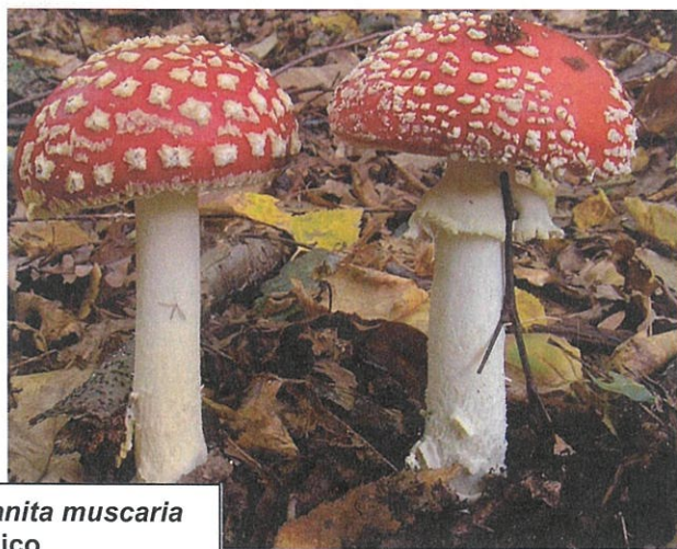
Amanita muscaria tossico