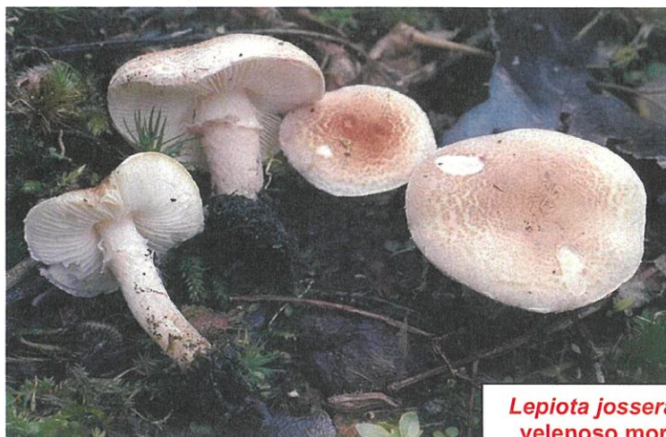
Lepiota josserandii velenoso mortale